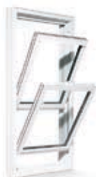
FENÊTRE À GUILLOTINE DOUBLE