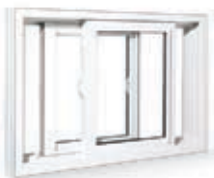
FENÊTRE COULISSANTE DOUBLE

Système multichambre assurant l'isolation thermique et sonore